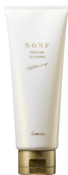
NONFスキンケア クレンジング

NONFスキンケアシリーズは、5つのアイテムをライン使いすることで、それぞれの効果を引き出し、より美しい肌へと導きます。